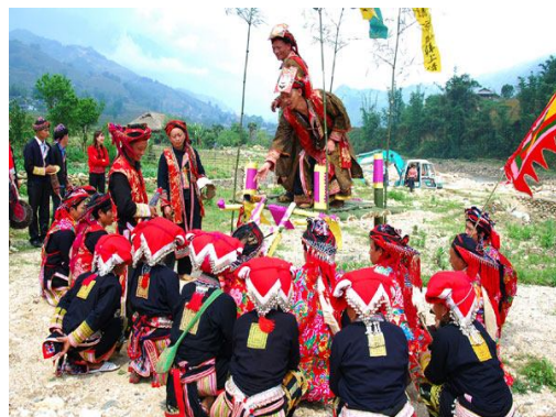
Hình 2. Lễ hội cấp sắc của đồng bào dân tộc Dao

Bên cạnh đó, việc đeo bám khách du lịch hiện nay vẫn còn diễn ra thường xuyên, chưa được giải quyết triệt để. Sa Pa đang có gần 500 trường hợp người dân hoạt động bán hàng bằng hình thức chèo kéo, đeo bám du khách; trong đó có cả người lớn và trẻ em, chủ yếu là người dân tộc thiểu số trên địa bàn huyện. Đặc biệt nguy hiểm là văn hóa phẩm đồi trụy được bày bán tràn lan tại thị trấn; lực lượng và các tổ chức phản động len lỏi vào các bản làng, vào từng hộ dân thông qua hình thức du lịch homestay để tuyên truyền, kích động nhằm phá vỡ niềm tin của đồng bào vào Đảng và Nhà nước, phá vỡ khối đại đoàn kết toàn dân. Đây là vấn đề đang làm đau đầu các nhà quản lý các cấp. Một lãnh đạo xã cho biết: “Xã phải cử công an, quân đội thường xuyên theo dõi, đi rình để đuổi đội tuyên truyền, kích động và chia rẽ người dân. Chúng thường nói xấu về văn hóa mình, nói xấu người nọ người kia để chia rẽ các dân tộc trong xã. Chúng thường lợi dụng việc đi du lịch để tuyên truyền trái phép. Người tuyên truyền là cả người Kinh và người Tây”.