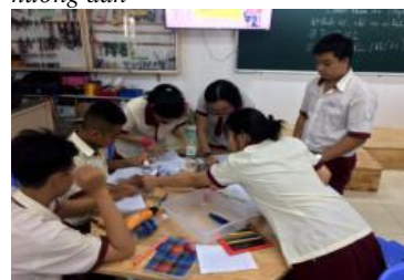
Hình 11. HS đang lắp ráp chế tạo và vận hành mô hình mô phỏng hô hấp ngoài của cơ thể người