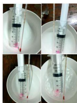
Hình 3. Bộ thí nghiệm kiểm chứng định luật Gay Lussac