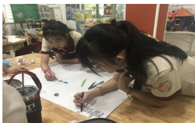
Hình 9. HS đang vẽ sơ đồ tư duy tổng hợp kiến thức hô hấp ngoài ở cơ thể người