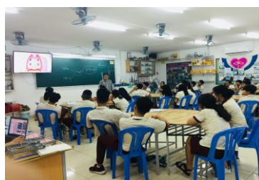
Hình 7. HS đang xem clip về hô hấp ngoài ở cơ thể người