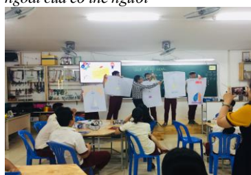
Hình 13. HS các nhóm đang trưng bày poster và mô hình mô phỏng hô hấp ngoài của cơ thể người