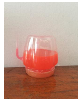
Hình 4. Mô hình dự báo thời tiết phong vũ biểu