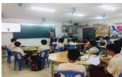
Hình 6. GV đang đặt vấn đề với HS