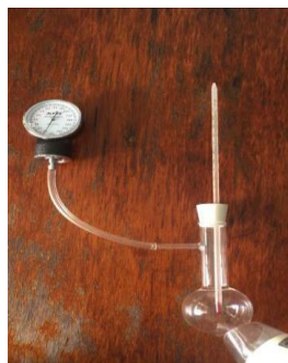
Hình 2. Bộ thí nghiệm kiểm chứng định luật Charles