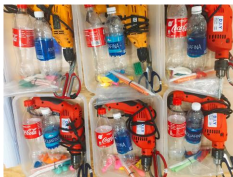
Hình 5. Bộ vật liệu, thiết bị chế tạo mô hình mô phỏng hô hấp ngoài của cơ thể người

- Vật liệu, thiết bị cần thiết để chế tạo mô hình mô phỏng hô hấp ngoài của cơ thể người cho các nhóm (mỗi nhóm từ 4-6 HS).