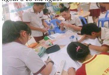
Hình 10. HS đang gia công các chi tiết để chế tạo mô hình mô phỏng hô hấp ngoài của cơ thể người