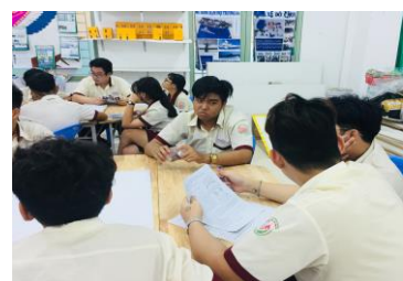
Hình 8. HS đang nghiên cứu tài liệu hướng dẫn