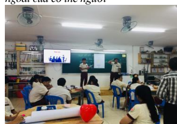
Hình 14. HS đang thuyết trình và vận hành mô hình mô phỏng hô hấp ngoài của cơ thể người trước lớp

Thực tế thực nghiệm cho thấy, tiến trình trên tạo điều kiện cho HS phát huy tính tích cực và bồi dưỡng NL sáng tạo. Căn cứ vào các tiêu chí đánh giá tính tích cực và NL sáng tạo, kết hợp sản phẩm của HS và quan sát của GV; chúng tôi ghi nhận được một số biểu hiện về tính tích cực và NL sáng tạo của HS. Điều đó được trình bày cụ thể ở Bảng 4 và Bảng 5 sau đây: