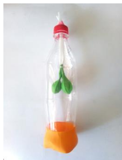
Hình 1. Mô hình mô phỏng hô hấp ngoài của cơ thể người