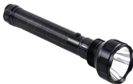
Hình 3. Đèn Pin siêu sáng Wasing WFL-H2 ( https://wasing.vn/den-pin-sieu-sang-wasing-wfl-h2/ )

Cho hình ảnh chiếc đèn pin quen thuộc hằng ngày: Đèn pin siêu sáng Wasing WFL-H2