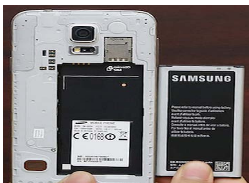
Hình 2. Pin điện thoại Samsung ( https://www.eprice.it/batterie-SAMSUNG/d-52582494 )

Câu 1 (1) . Thông số mAh trên pin điện thoại là gì? Tại sao chữ “A” ở giữa luôn được viết hoa.