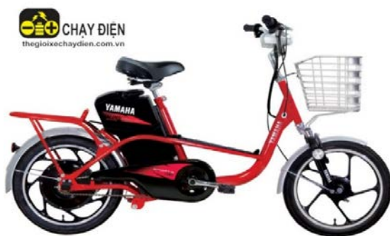
Hình 1. Xe đạp điện hãng Yamaha loại ICATS H1

Thuật ngữ “xe đạp điện” được định nghĩa tại Khoản 1 Điều 3 Thông tư 41/2013/TT-BGTVT quy định về kiểm tra chất lượng an toàn kĩ thuật xe đạp điện do Bộ trưởng Bộ Giao thông Vận tải ban hành như sau: Xe đạp điện là xe đạp hai bánh, được vận hành bằng động cơ điện một chiều hoặc được vận hành cơ cấu đạp chân có trợ lực từ động cơ điện một chiều, có công suất động cơ lớn nhất không lớn hơn 250 W, có vận tốc thiết kế lớn nhất không lớn hơn 25 Km/h và có khối lượng bản thân (bao gồm cả ắc quy) không lớn hơn 40 kg (Ministry of Transport, 2013).