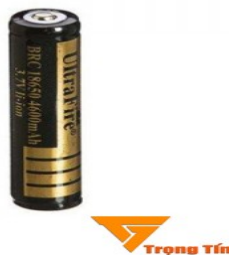
Hình 4. Pin Li-ion 18650

Câu 3. (2) Một pin Li-ion 18650 loại như đã cho có giá là 70.000 đồng, thông số kèm theo: 3,7V; 4600mAh.