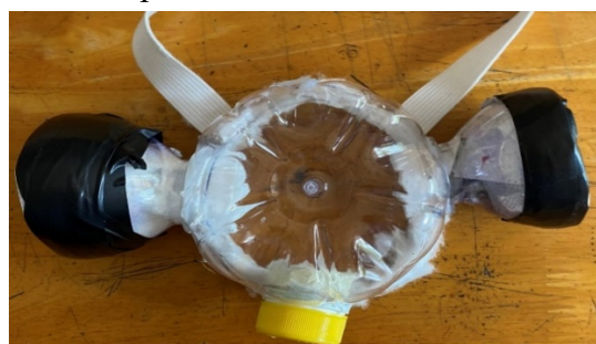
Hình 4. Minh họa một sản phẩm mặt nạ phòng độc của HS

Kết quả khảo sát ý kiến của 32 HS tham gia được thể hiện ở bảng dưới đây