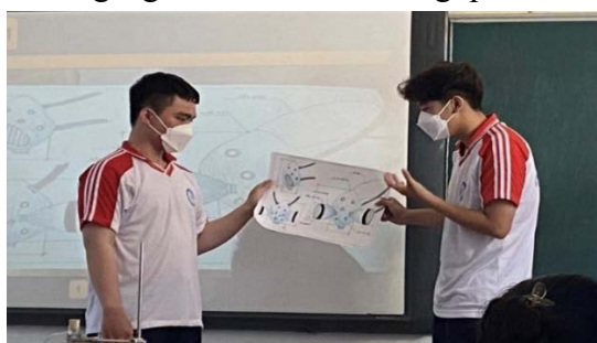
Hình 3. HS thuyết trình về bản thiết kế

- Các sản phẩm mặt nạ phòng độc của các nhóm đáp ứng được các tiêu chí đánh giá, và có nhiều điểm sáng tạo trên cơ sở tìm hiểu các kiến thức khoa học. So sánh sự khác biệt giữa các bản thiết kế, các sản phẩm mặt nạ phòng độc cũ và sau khi đã điều chỉnh có thể thấy được quá trình cố gắng, nỗ lực của HS trong quá trình thực hiện sản phẩm.