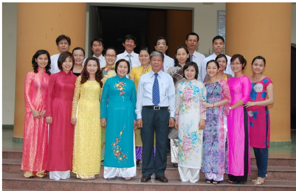
Đội ngũ cán bộ giảng viên của Khoa GDMN

Chất lượng đào tạo của Khoa phụ thuộc vào nhiều yếu tố, trong đó yếu tố quyết định chính là đội ngũ giảng viên. Hiện nay, Khoa có 19 giảng viên và 3 cán bộ văn phòng, trong đó có 1 tiến sĩ, 11 thạc sĩ, 2 giảng viên đang học cao học và 2 giảng viên đang học nghiên cứu sinh. Các cán bộ, giảng viên trong Khoa luôn có tinh thần trách nhiệm cao với công việc, có lòng yêu nghề và sự đoàn kết, chung sức chung lòng vượt qua mọi khó khăn, trở ngại để cùng nhau hoàn thành tốt các nhiệm vụ được giao phó.